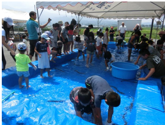
【うなぎのつかみどりの様子】