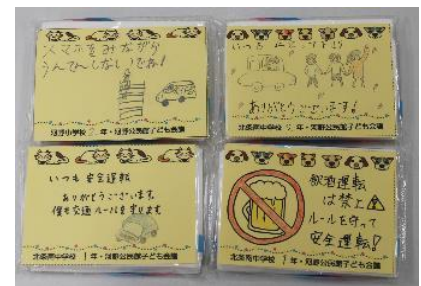
小・中学生全校生徒に協力してもらった『交通安全メッセージ』

また、実施日を春の交通安全週間の期間に設定することにより、松山西警察署や交通安全協会の方にお手伝いいただき、子どもたちの安全確保をしています。