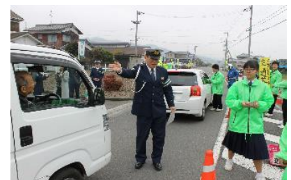
警察官に車を停めてもらい、作成したメッセージ入りポケットティッシュを手渡し