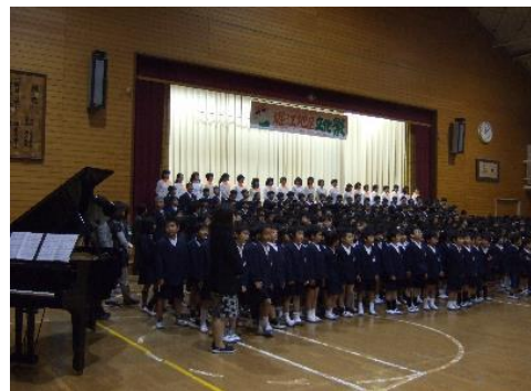
【ふるさとほりえ讃歌の合唱】