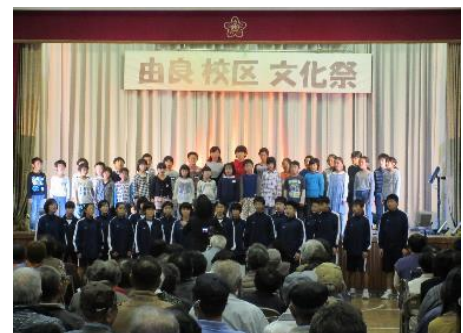
【小中学校児童生徒による合唱】