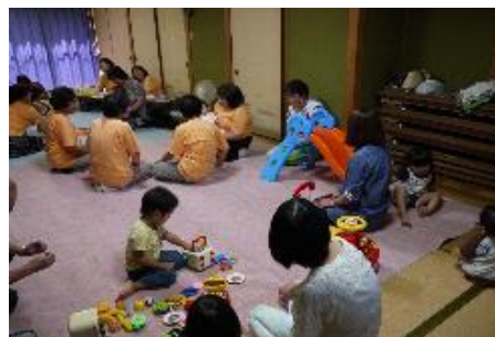
【紙芝居や絵本等の読み聞かせ】 子育てサロンゆうぐん(雄郡公民館)

利用者同士の会話はずみ、次第に友達になり、スタッフとの会話を通して悩みの解消、子育てについての知識を得る機会ができ、徐々に成果が出てきている。