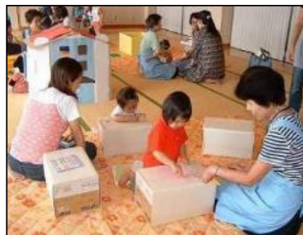
【お絵書きにダンボール箱を利用】 子育てサロンどいだ(土居田分館)