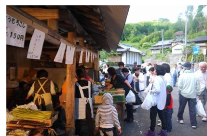
【地元の方が地元特産品などを販売しています】

また、「五明太鼓」や「獅子舞」など、伝統芸能の発表の場となるなど、地域や学校が連携・協働する、文字どおり、今日の公民館活動に求められている取り組みでもあります。