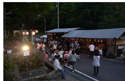
【日も暮れ始め、多くの方が集まっています】

当日は、地元特産品や加工品を販売しており、オープニングでは、五明小学校の児童が、「五明太鼓」と「獅子舞」を披露します。