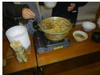
【表彰式後ふるまわれる、しし汁うどん】